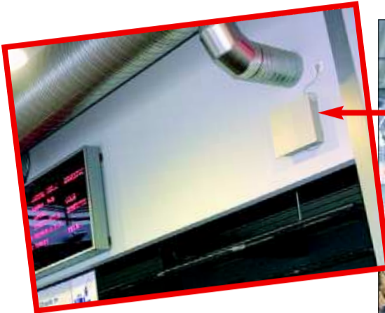
Na Lublinku pachnie pomarańczami dzięki czterem takim pompom.