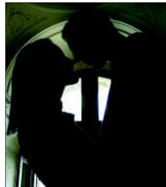
W pocałunkach może czyhać... mononukleozę, zakaźna choroba objawiająca się m.in. wysoką gorączką.

W zeszłym roku w Łodzi zachorowało na mononukleozę 177 osób, z tego aż 143 były hospitalizowane. Chorzy wymagali intensywnego leczenia. Trzeba było podawać im kroplówki. Nawet po ustąpieniu objawów pacjent może jeszcze zakażać wirusem Epsteina-Barra. Powinien być podany dłuższej kwarantannie.